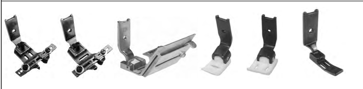
A736 guida multipla 3/16-1/4 A737 guida multipla zig zag S570G guida nastro regolabile MT107 teflon zz kl 107-457 MT112 teflon 2 aghi da 1/8 a 1/2 kl 112-212 259635 2 aghi stretto 1/8-3/16-1/4 kl 112-212