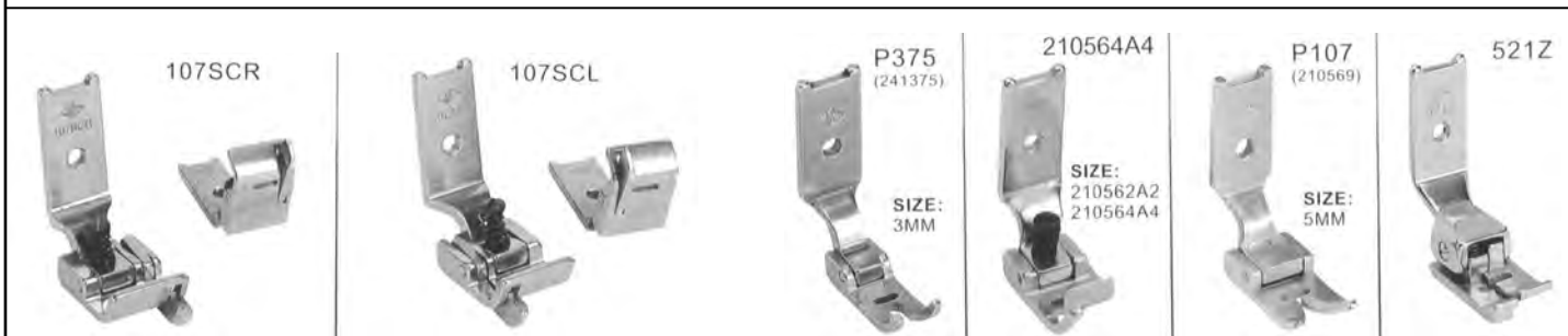
Zig zag con guida mobile zig zag diversi per Singer 107/457 e similari