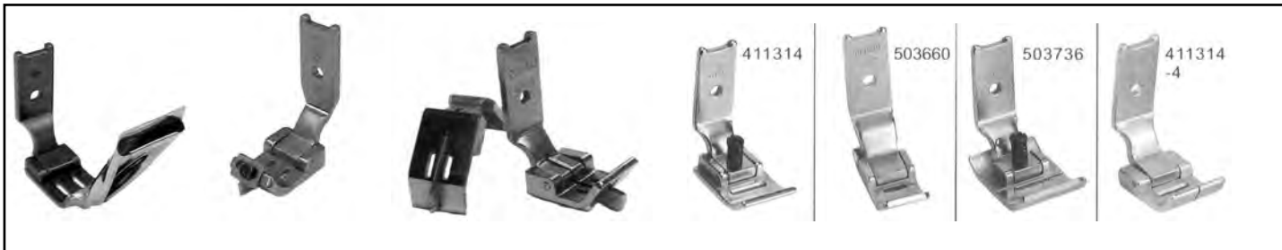
MS112 3/16-1/4 S570REG 3/16 1/4 S570C con guida compensata 2 aghi 1/8 - 3/16 - 1/4 - 3/8 vari zig zag Singer 107/457 chiedere x mis.nastro