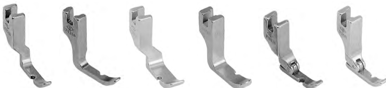
A650 sinistro A650SD c/salvadito (31358N) A652 destro A652SD c/salvadito A652B g.basso (12435N) A651 sinistro A651SD c/salvadito (31358W) A653 destro A653SD c/salvadito (12435W) A654 sinistro A654SD c/salvadito A654E economico (31358HN) A657 destro A657SD c/salvadito A657E economico (12435HN)