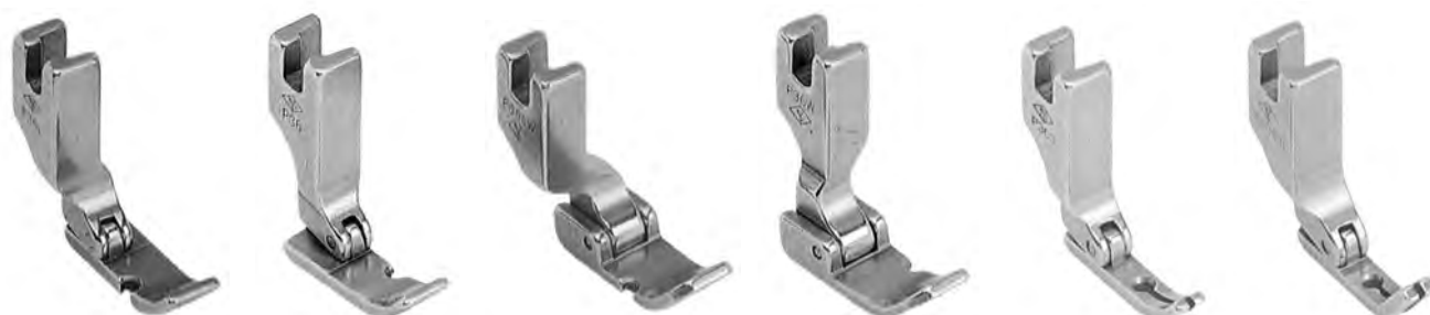
A655 sinistro A655SD c/salvadito A655E economico (31358HW) A656 destro A656SD c/salvadito A656E economico (12435HW) A655W sinistro extra largo (P36LW) A656W destro extra largo (P36W) A658 A658SD c/salvadito A658E economico (40322SH) A659 A659SD c/salvadito A659E economico (165010H)