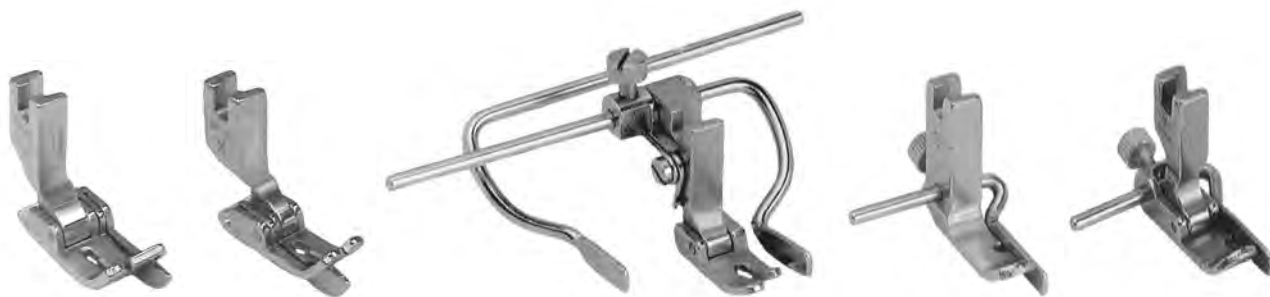
A880 destro A881 sinistro piedini con guida elastica 1/32-1/16-1/8-3/16-1/4 (SP18) (SP18L)