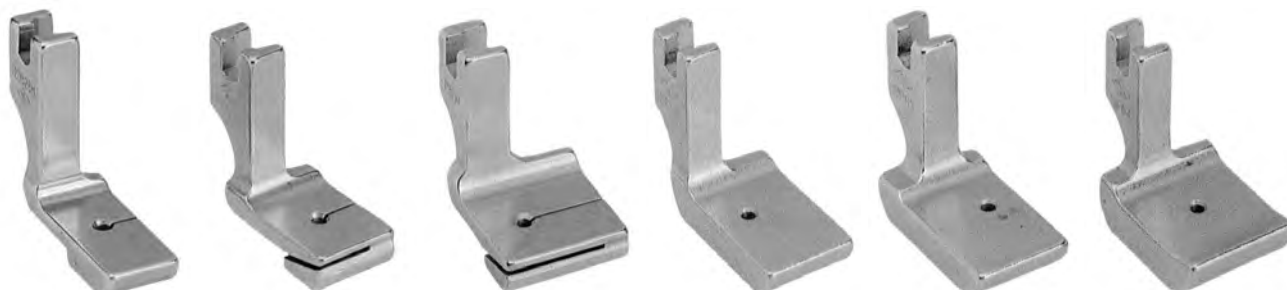
A694 gradino basso A695 gradino medio A696 gradino alto (P50N-P50-P50H)