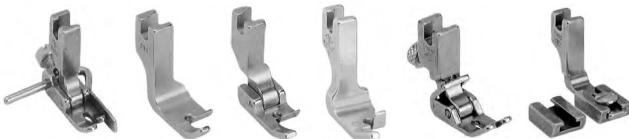
A709 piedino con guida dx (P803)