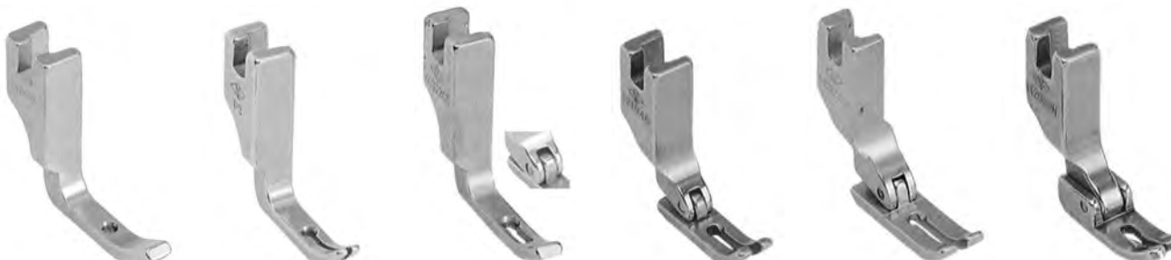
A658R cerniere rigido (40322) A8000 cerniere rigido (165010) A8001 cerniere rigido A8001H snodato (CS40322/40322H) A658W ciabatta pari A658WSD c/salvadito (121946) A660 ciabatta pari largo A660SD c/salvadito (142058) A661 ciabatta stretta A661SD c/salvadito (142058N) A661E economico