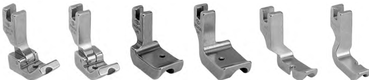
A824 sinistro 1/8-3/16-1/4 (36069HL)