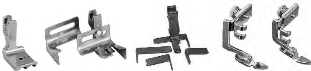
A823 1/8-3/16-1/4 (P69D) A713 piedino con guide (S524) A713B piedino con guide (35137) A710 per cerniere regolabile gambo alto A711 per cerniere regolabile gambo basso