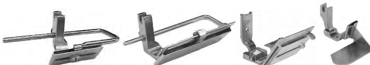
A706BIS piedino con tubo guida nastro regolabile tubi intercambiabili in dotazione A706 piedino guida nastro regolabile tubo grande fisso S570G guida nastro regolabile per ZZ attacco piatto A689G guida nastro mm 12,7 con appoggio (S532)