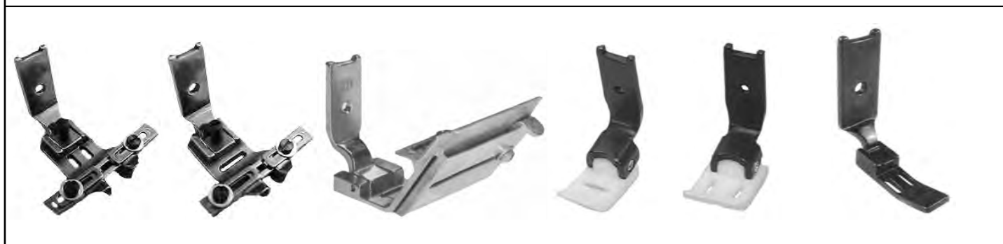
A736 guida multipla 3/16-1/4 A737 guida multipla zig zag S570G guida nastro regolabile MT107 teflon zz kl 107-457 MT112 teflon 2 aghi da 1/8 a 1/2 kl 112-212 259635 2 aghi stretto 1/8-3/16-1/4 kl 112-212