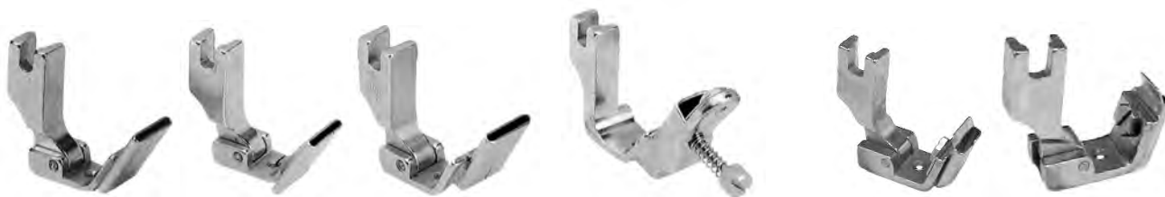
A689 con tubo centrale misure tubi fornibili : 1/8-3/16-1/4-5/16-3/8-1/2-5/8-3/4-1" A689S tubo a sinistra (S10C-R-L) A689D tubo a destra A669 1/8 A671 1/4 A673 1/2 A670 3/16 A672 3/8 A689R piedini guida fettuccia tubo intercambiabile 1/8-3/16-1/4-3/8-5/16-1/2 A689RT solo tubo varie misure A689V vite