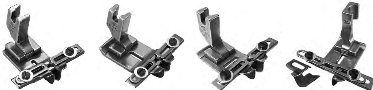
A730 Normale diritto A731 trasporto ago A732 zig zag A733 trasporto ago DK 212 PIEDINI MULTIGUIDA – GUIDANASTRO – GUIDA DESTRA – GUIDA SINISTRA Sono fornibili anche con attacco lungo PFAFF 142/1242/1245 ( A734 ) e Necchi 881 ( A735 )