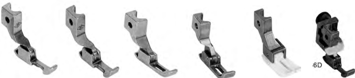
A2410 suola mm.5,4