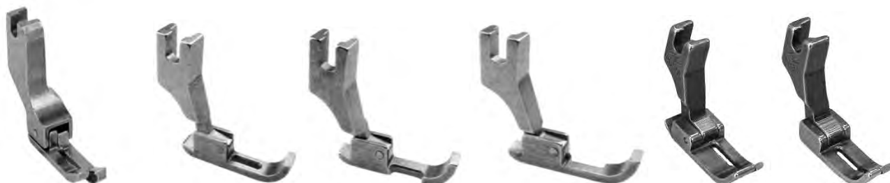
A900 destro 1/32-1/16-1/8-3/16-1/4 compensatori kl.831 A900S sinistro 1/32-1/16-1/8-3/16-1/4 compensatori kl.831 A902 kl.881 A903 kl.881 A904 kl.881 961761 kl.881 961789 kl.881