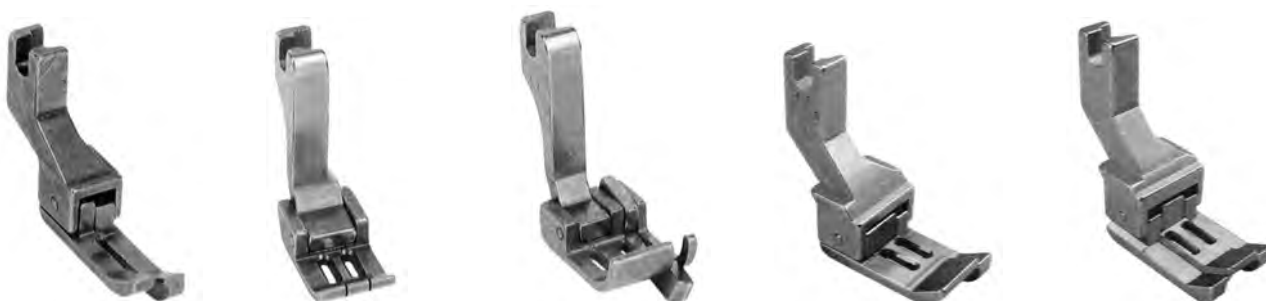
A901 destro 1/32-1/16-1/8-3/16-1/4 5/16-3/8 compensatori kl.881 A901S sinistro 1/32-1/16-1/8-3/16-1/4 5/16-3/8 compensatori kl.881 30715 mm.4,8 961044-300 mm.6 961044-310 mm.6,4 kl.921-925 stretto:vedi Pfaff 40811ST destri A890 4,8-1 A890 4,8-2 A891 6,4-1 A891 6,4-2 sinistri A892 4,8-1 A892 4,8-2 A893 6,4-1 A893 6,4-2 kl.921-925 destro A818 4,8-1 A818 4,8-2 A819 6,4-1 A819 6,4-2 kl.921 tipo vecchio doppio A818D 4,8-2 A819D 6,4-2 kl.921 tipo vecchio