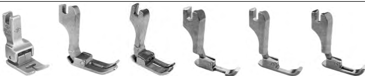
A833/3 mm.3 A833/5 mm.5 comp.doppio zz. 146409 kl.831 956332 kl.831 A906 kl.831 ciabatta mm 5,4 A906L mm 7 A907 kl.831 ciabatta mm 5,4 A907L mm 7 A905 cerniere kl. 831