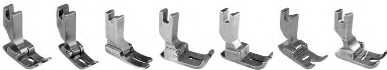
A665 kl.830-885 A664 kl.830-885 956378 kl.830-885 956517 kl.885 956653 kl.885 110409 kl.720-750 956099 kl.720-750